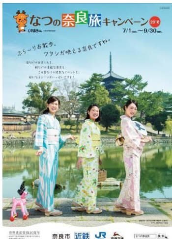
(パンフレット表紙)